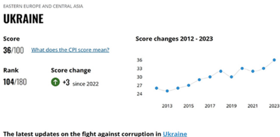
Рис. 2. Рейтинг України у світовому рейтингу Індексу сприйняття корупції (Corruption Perceptions Index) за 2023 рік (Transparency International) (Рейтинг України у світовому рейтингу Індексу сприйняття корупції, 2023)

Країни, які займають високі позиції в Індексі сприйняття корупції, мають власну проблему безкарності, навіть якщо це не відображено в їхніх балах. У багатьох справах про транскордонну корупцію були залучені компанії з кращих країн, які вдавалися до хабарництва під час ведення бізнесу за кордоном. Інші залучають професіоналів, які продають таємницю або іншим чином допомагають іноземним корумпованим чиновникам. І все ж країни, які отримали найкращі результати, часто не встигають переслідувати винних у транснаціональній корупції та їх сприяння (Corruption Perceptions Index, 2023).