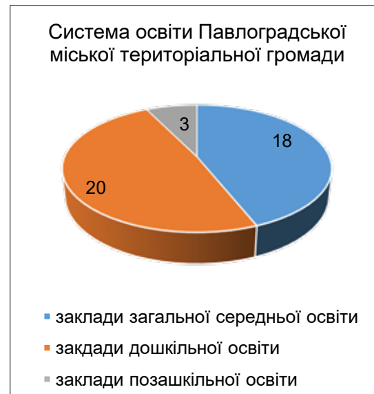
Рис. 5. Система освіти Павлоградської міської територіальної громади

Відповідно до рішення Балтської міської ради Одеської області від 23 грудня 2020 року № 58-VII «Про переведення закладів загальної середньої, дошкільної, позашкільної освіти та комунальних установ «Балтський інклюзивно-ресурсний центр», «Центр професійного розвитку педагогічних працівників» Балтської міської ради Одеської області на умови самостійного ведення господарської діяльності та бухгалтерського обліку» (Про переведення закладів загальної середньої, дошкільної, позашкільної освіти та комунальних установ «Балтський інклюзивно-ресурсний центр», «Центр професійного розвитку педагогічних працівників» Балтської міської ради Одеської області на умови самостійного ведення господарської діяльності та бухгалтерського обліку), заклади освіти Балтської міської територіальної громади переведено на умови самостійного ведення господарської діяльності