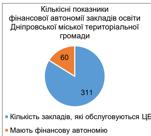
Рис. 2. Кількісні показники фінансової автономії закладів освіти Дніпровської міської територіальної громади