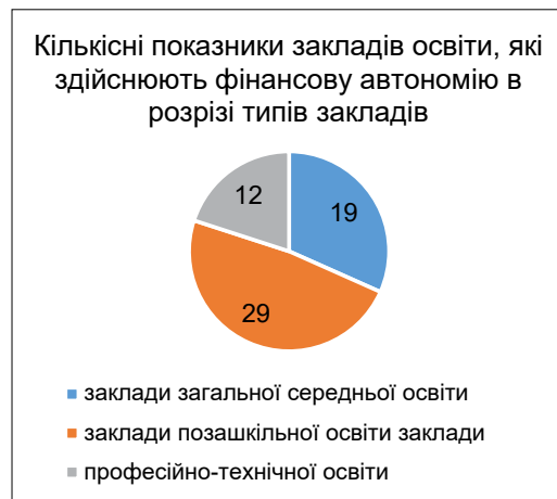
Рис. 3. Кількісні показники фінансової автономії закладів освіти Дніпровської міської територіальної громади в розрізі типів закладів