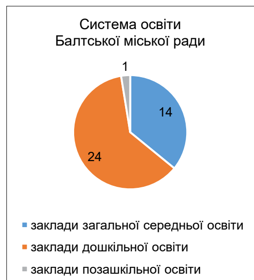
Рис. 6. Система освіти Балтської міської територіальної громади