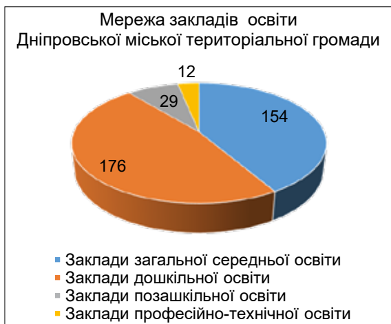
Рис. 1. Мережа закладів освіти Дніпровської міської територіальної громади

ної освіти, культури, фізичної культури і спорту. Відповідно до положення про департамент молодіжної політики та національно-патріотичного виховання Дніпровської міської ради від 21.04.2021 року № 82/6 «Про затвердження Положення про департамент молодіжної політики та національно-патріотичного виховання Дніпровської міської ради» (Про затвердження Положення про департамент молодіжної політики та національно-патріотичного виховання Дніпровської міської ради), основними завданнями діяльності департаменту є реалізація міської політики у сфері позашкільної освіти. Таблиця 2 показує підпорядкування закладів освіти Дніпровської міської територіальної громади.